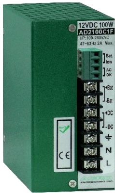
Dimensions: 121(D)x56(W)x110(H) mm