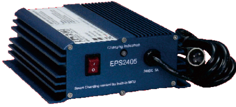
Dimensions: 150(D)x153(W)x59(H) mm