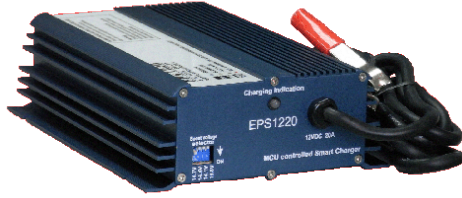
Dimensions: 150(D)x153(W)x59(H) mm