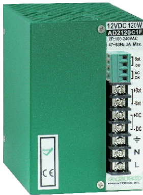
Dimensions: 121(D)x75(W)x110(H) mm